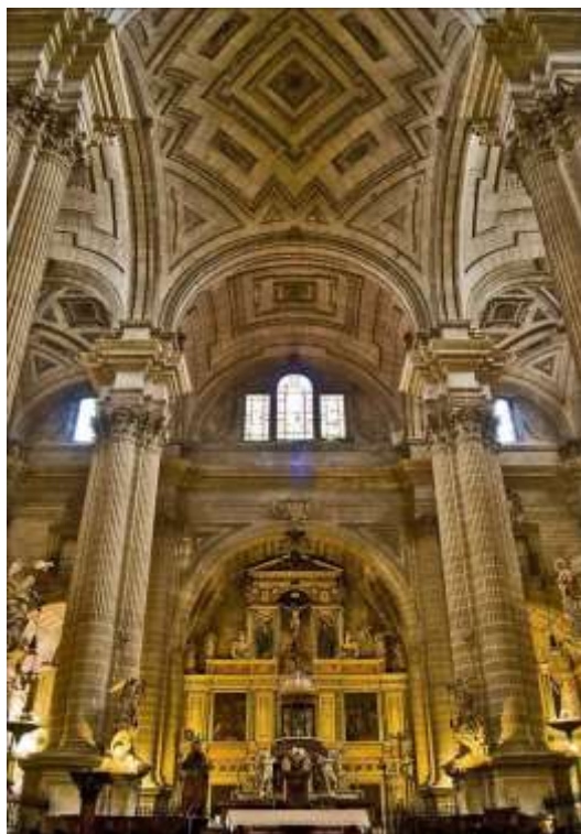
Altar Mayor y nave central de la Catedral de Jaén. (1249-1724). Arquitectos: Andrés de Vandelvira, Juan de Aranda Salazar, Eufrosio López de Rojas

Se pretende visitar entre otros la Santa Iglesia Catedral (Sacristía Mayor, Sala Capitular...), el Museo-Centro de Interpretación de Arte Ibérico, el Castillo de Santa Catalina y el Palacio de Villardompardo.